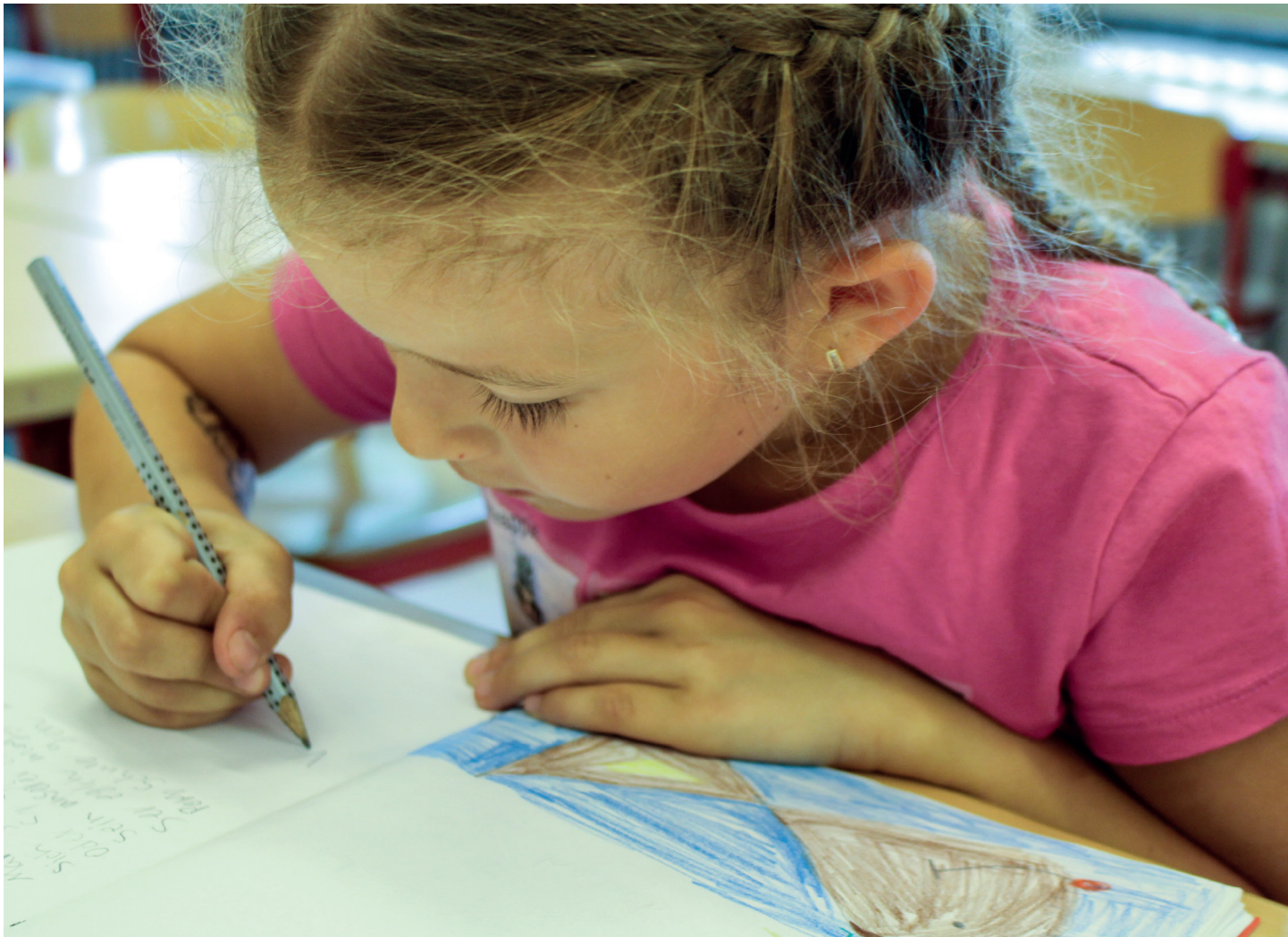
Sophie schreibt einen eigenen Text.

Aus den unterschiedlichen Studien sei hier exemplarisch auf die Studie „BeLesen“ (Schröder-Lenzen/Mücke 2005) verwiesen, in der vier Konzeptionen von „sehr offen“ (Lesen durch Schreiben nach Reichen) bis „sehr eng“ (traditionelle Fibel) verglichen werden. Sie bestätigt, was viele Lehrerinnen und Lehrer im Alltag erfahren: Die Extrempositionen sind weniger erfolgreich als eine Integration von Methoden. Dies bedeutet, dass weder Klassen, in denen ausschließlich mit einer traditionellen Fibel noch Klassen, in denen ausschließlich nach dem Modell „Lesen durch Schreiben“ in seiner ursprünglichen Fassung nach Reichen unterrichtet wurde, am besten abschnitten. Am erfolgreichsten lernen Kinder – und das gilt auch für Kinder, die Deutsch als Zweitsprache erlernen –, wenn eine „strukturierte Spracherfahrung“ ermöglicht wird, wie es der Fall ist, wenn das freie Schreiben mit einer Anlauttabelle und die Betrachtung von Sprachstrukturen verbunden werden. Um genau diese Verbindung geht es in meiner Konzeption von Unterricht (Leßmann 2018).