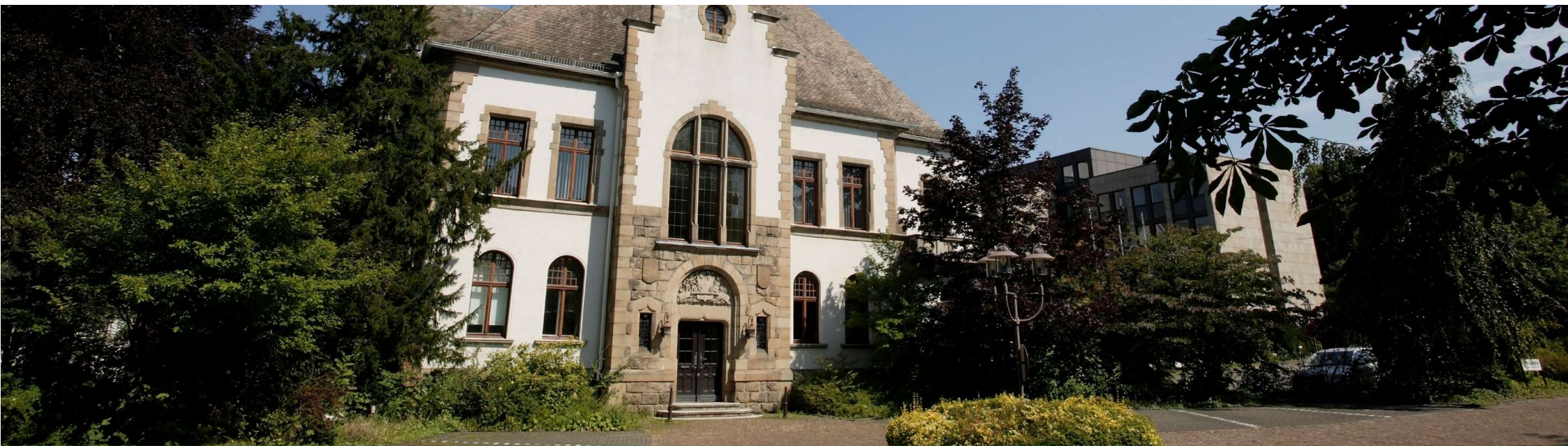
Abbildung: Kreishaus Arnsberg